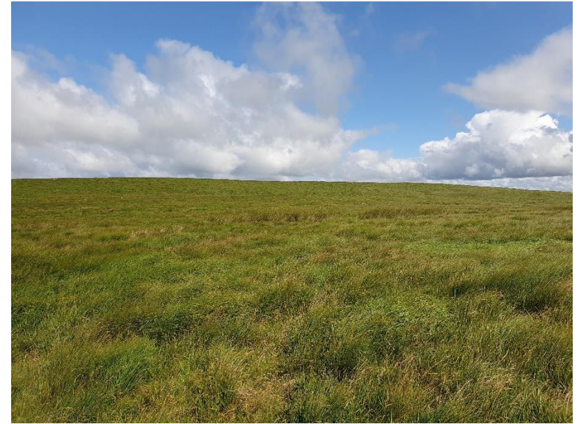
Ffigur 1: Golygfa tuag at gogledd-orllewin Gorffennaf 2023

Mae Ymddiriedolaeth Cwm Elan yn cynnig cyfle prin i ffermio 140.80 hectar (odduetu 347.90 erw) sy'n dal o fewn Ystâd Elan. Ymddiriedolaeth Cwm Elan (yn ffurfiol Ymddiriedolaeth Elan Dŵr Cymru; Rhif Elusen 1001347) sy'n gyfrifol am weinyddu'r rhan fwyaf 72 milltir o sgwâr Ystâd Elan. Mae Ystâd Elan yn dod o fewn Mynyddoedd Cambrian (ardal a ddynodwyd gynt yn Ardal Amgylcheddol Sensitif (ESA)), yn Ardal Gwarchodaeth Arbennig (AGA) ar gyfer adar gwyllt, mae ganddi Ardaloedd Cadwraeth Arbennig (ACA) ar gyfer cynefinoedd ac mae'r rhan fwyaf o'r tir wedi'i ddynodi'n Safleoedd o Ddiddordeb Gwyddonol Arbennig (SoDdGA neu SSSI). Amcanion yr Ymddiriedolaeth yw hyrwyddo cadwraeth, mynediad cyhoeddus priodol a lledaenu gwybodaeth am yr ystâd. Mae'r holl dir fferm agored yn ddarostyngedig i hawl mynediad cyhoeddus ar droed, ac mae yna lawer o hawliau tramwy a manau eraill o ddiddordeb. Bydd yr Ymddiriedolaeth yn ymdrechu i gynnig cyfleoedd tenantiaeth newydd i'r rhai sy'n rhannu gwerthoedd amcanion ac uchelgeisiau'r Ymddiriedolaeth a bydd yn gweithio gyda thenantiaid i ddatblygu systemau ffermio gwerth natur uchel fel modd o gyflawni ein hamcanion.