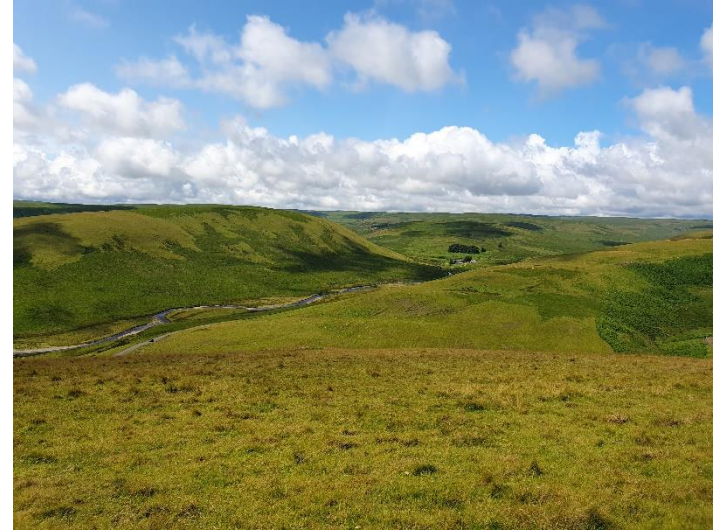
Ffigur 5: Golygfa i fyny'r dyffryn Gorffennaf 2023