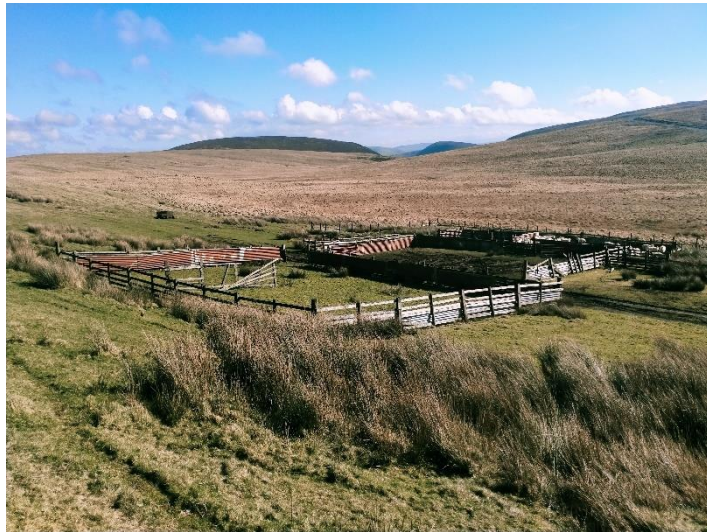
Ffigur 4: Corlannau Trin Mawrth 2024

Rheolwr Asiant Cynorthwyol ac Eiddo Swyddfa Ystad Elan Rhif Ffôn 01597 810449 E-bost: charis@elanvalley.org.uk