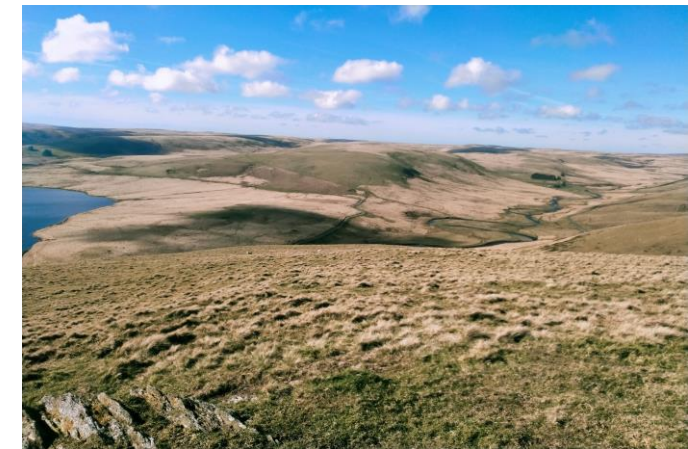
Ffigur 3: Golygfa ar draws y Dyffryn Mawrth 2024