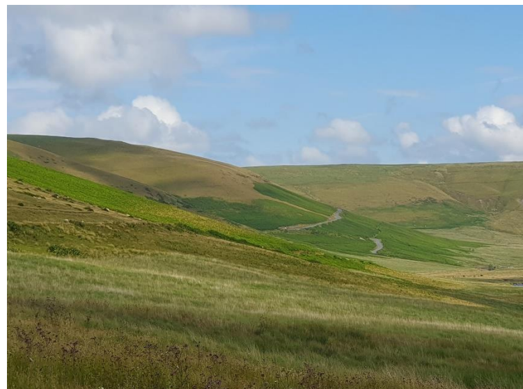
Ffigur 6: Golygfa o Ffordd y Mynydd Gorffennaf 2023

Manylion parcel caeau a gymerwyd o RPW Ar-lein.