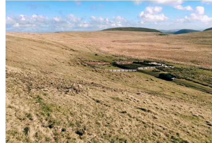
Ffigur 2: Corlannau trafod presennol Mawrth 2024

Roedd opsiynau Glastir ar waith tan 31 Rhagfyr 2023, a bydd y Perchennog yn parhau i'w ffermio yn unol â hynny tan 13 Mai 2024. Y gyfradd stocio uchaf fu 0.05 LUs yr hectar ar gyfer 1 Hydref a 31 Mawrth ac ar gyfer 1 Ebrill a 30 Medi mae o leiaf 0.17 LUs ac uchafswm o 0.31 LUs yr hectar. Cyfrifoldeb y tenant bydd cadw at unrhyw gynlluniau rheoli tir mewn perthynas â'r SoDdGA, fodd bynnag, gallwn gynghori bod rhywfaint o drugarogrwydd yn y cyfraddau isaf yn ystod y flwyddyn gyntaf gan y byddai'r pori gorau posibl yn cynnwys, dyweder 15 o wartheg rhwng Mehefin a Medi a allai fod yn fuddsoddiad sylweddol.